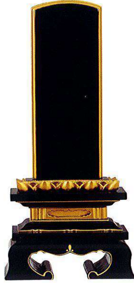
5-2 純面粉 蓮華付春日楼門 <国産>