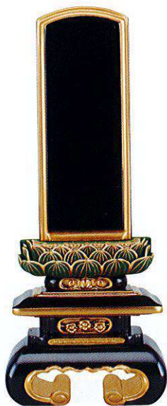
7-1 純面粉 青吹蓮華 上京中台 巻足