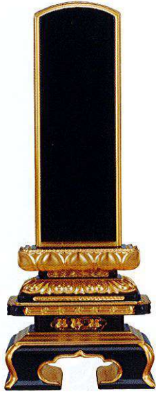
3-1 純面粉 極上千倉 和蓮華 呂色 桐箱入り