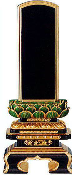
3-2 純面粉 極上千倉 青吹蓮華 呂色 桐箱入り