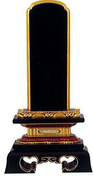
5-3 純面粉 勝美楼門 <国産>