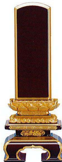
7-4 純面粉 上京型千倉座 吹蓮華 溜色