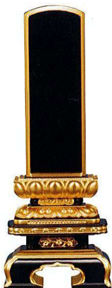
7-5 純面粉 唐蓮華 京型千倉座