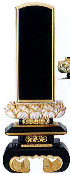
7-2 純面粉 白吹蓮華 上京中台 巻足