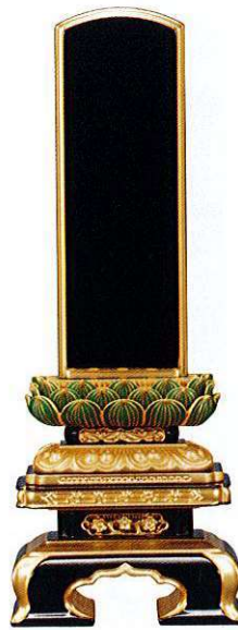
7-7 純面粉 青吹蓮華 京型千倉座