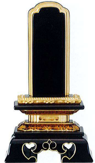
3-6 純面粉 勝美楼門 呂色 桐箱入り