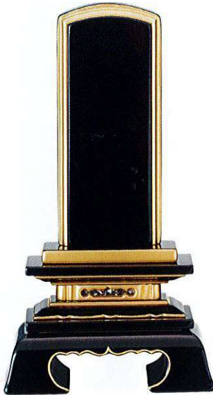
3-4 純面粉 春日楼門 呂色 桐箱入り