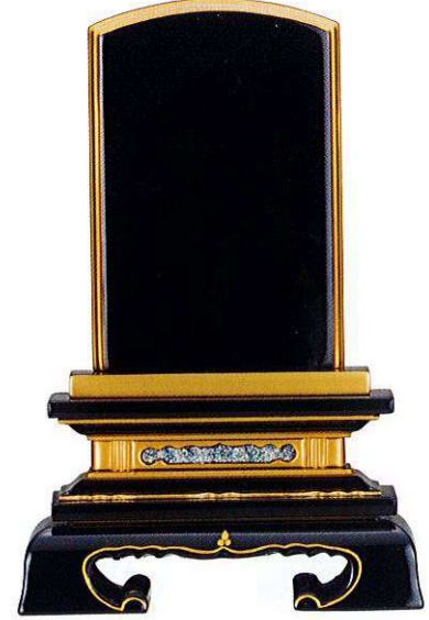
5-6 純面粉 春日楼門 巾広 <国産>