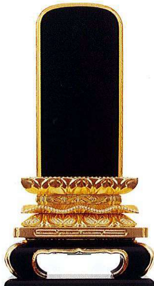
5-5 純三方金 猫丸位牌 <国産>