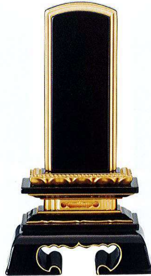
3-5 純面粉 蓮付春日楼門 呂色 桐箱入り