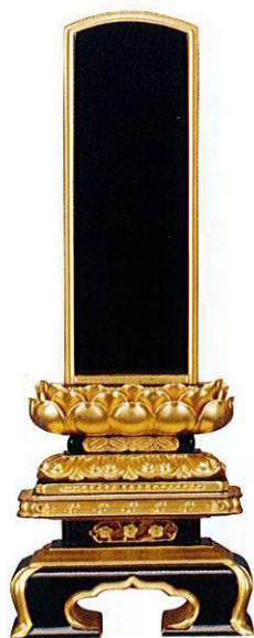
7-6 純面粉 金吹蓮華 京型千倉座