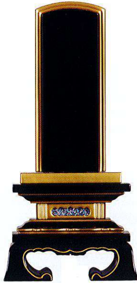
5-1 純面粉 春日楼門 <国産>