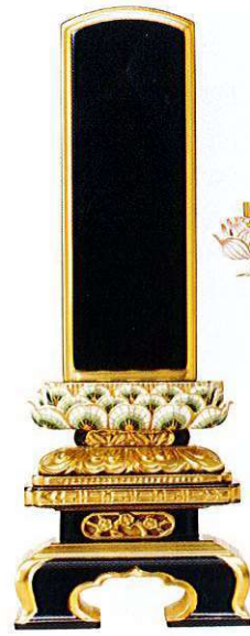
7-8 純面粉 孔雀蓮華 京型千倉座