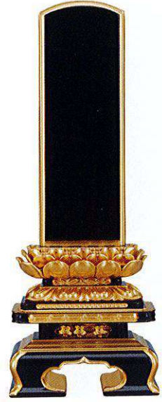
3-3 純面粉 極上千倉 吹蓮華 呂色 桐箱入り