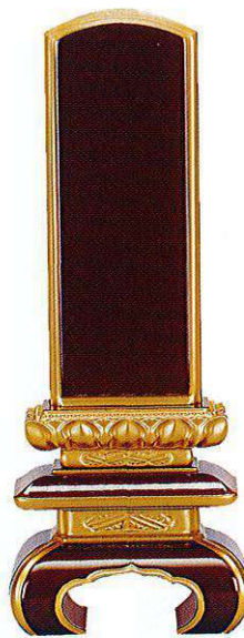
7-3 面粉 上京中台 溜色