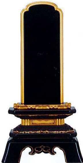
5-4 純面粉 角切葵 <国産>