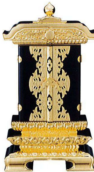
11-7 純前金 二間二重回 別上塗