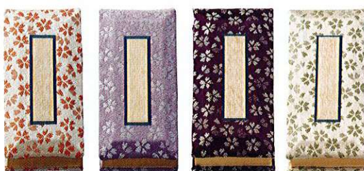
ピンク 薄紫 濃紫 緑