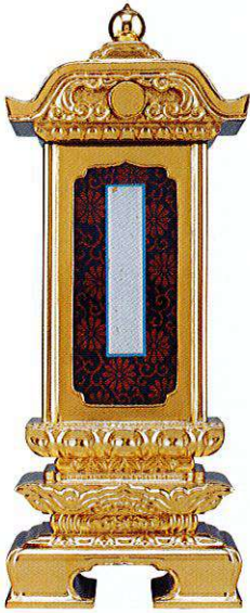
12-1 純前金 柱付二重過去帳回 別上塗