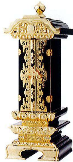
10-3 純前金 二重回 奥深 別上塗

A00 本金箔 Original ※寸法7.0以上はお問い合わせください ※中板は塗板1枚+白木板になります (全寸法共通)