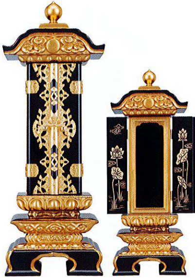
11-1 純面粉 二重回 扉時絵