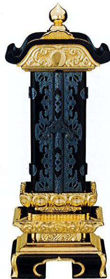
10-6 純面金 雲二重回 銀イブシ 別上塗

A00 本金箔 Original ※寸法7.0以上はお問い合わせください ※中板は塗板1枚+白木板になります (全寸法共通)