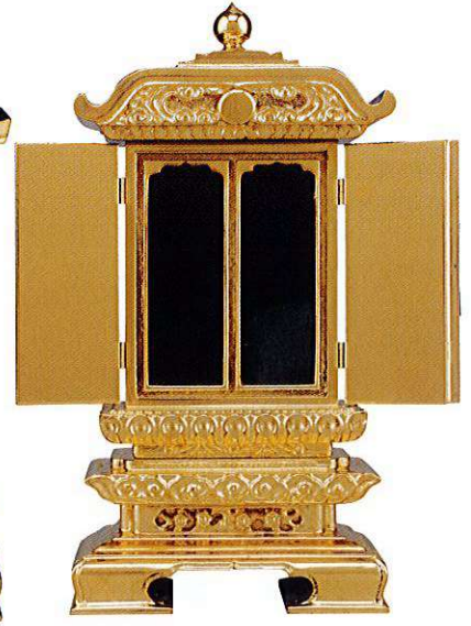
11-8 純三方金 二間雲二重回 別上塗

A00 本金箔 Original ※中板は塗板2枚+白木板になります。 (二間合計)