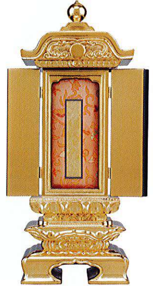
12-4 純前金 戸付二重過去帳回 鳥ノ子