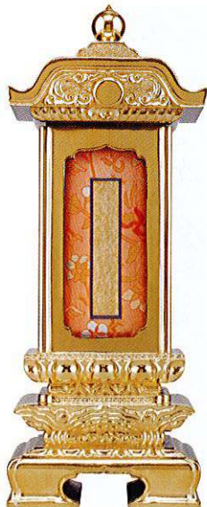
12-5 純前金 柱付二重過去帳回 鳥ノ子