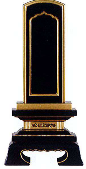
11-4 純面粉 春日回出 K

A00 本金箔 Original ※寸法7.0以上はお問い合わせください ※中板はPC書板1枚+白木板になります (全寸法共通)