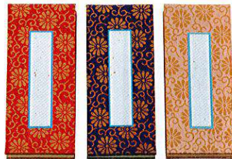
赤 紺 茶