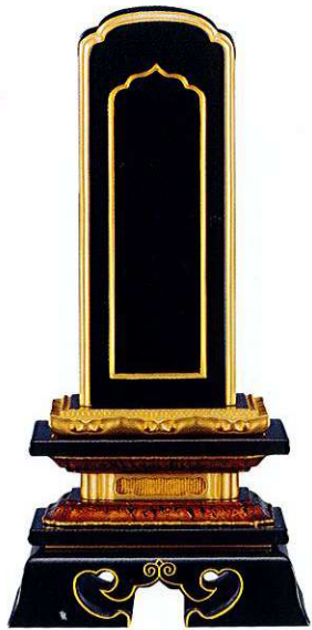
11-5 純面粉 勝美回出