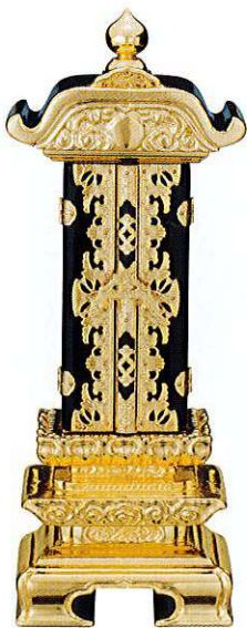
10-5 純三方金 雲二重回 別上塗

A00 本金箔 Original ※寸法7.0以上はお問い合わせください ※中板は塗板1枚+白木板になります (全寸法共通)