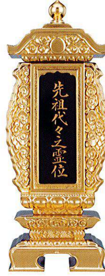
11-3 純前金 袖付二重回 別上塗

D29 本金粉 Original ※中板は塗板1枚+白木板になります (全寸法共通)