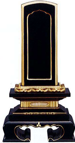
11-6 純面粉 蓮華付 春日回出