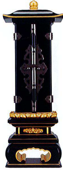
11-2 面粉 利休回出 イブシ金具打 K