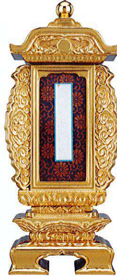
12-3 純前金 袖付二重過去帳回 別上塗