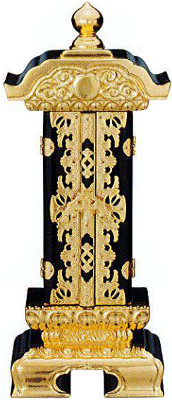
10-1 純前金 別上塗 続八双打 一重回