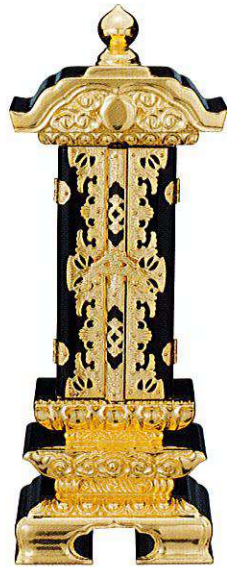
10-2 純前金 別上塗 続八双打 二重回