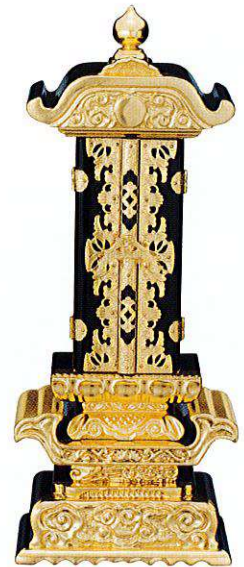
10-4 純前金 筆返回 別上塗

A00 本金箔 Original ※中板は塗板1枚+白木板になります (全寸法共通)