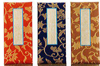
赤 紺 茶