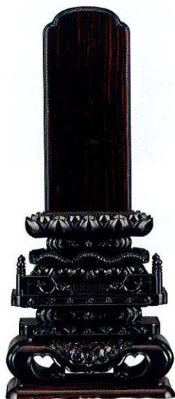
13-4 黒檀 切高欄