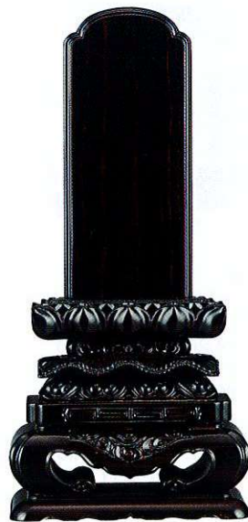
13-5 黒檀 上等猫丸