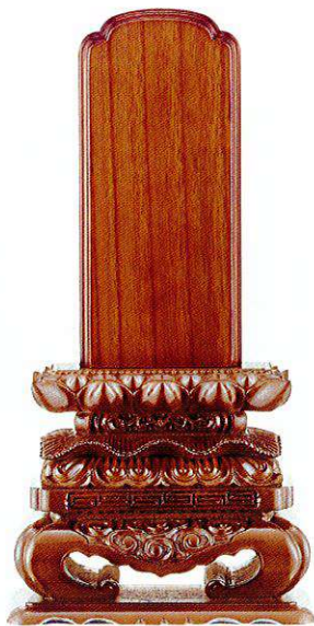
13-2 本ケヤキ 上等猫丸