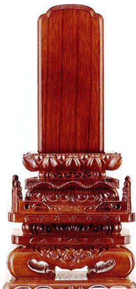
13-1 本ケヤキ 切高欄