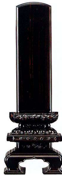
13-6 黒檀 上京型千倉座 吹蓮華