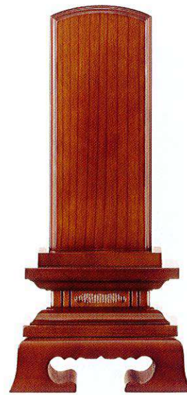
13-3 本ケヤキ 春日楼門